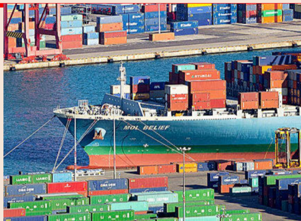
Puerto de mercancías.

En la actualidad hay 680 personas y 53 entidades que son objeto de medidas sancionadoras