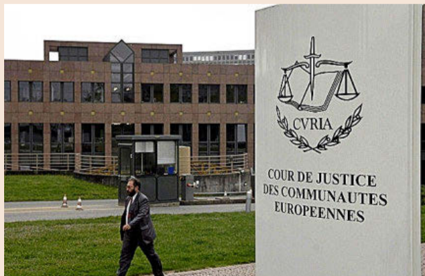
Tribunal de Justicia de la Unión Europea.

El mayor inversor ruso en estos momentos en España en una empresa cotizada, Mikhail Fridman, señaló que impugnará la decisión de la UE de incluirle en el listado de sancionados por su cercanía con el Kremlin. Como el propietario de Dia, cualquier sancionado tiene dos vías para intentar escapar de la sanción. Por un lado, la administrativa que consiste en enviar alegaciones al propio Consejo de la Unión Europea para que reconsidere la sanción. Por otro, y sin ser excluyente de la anterior, aparece la vía judicial. Así, los sancionados pueden presentar sus recursos ante el Tribunal