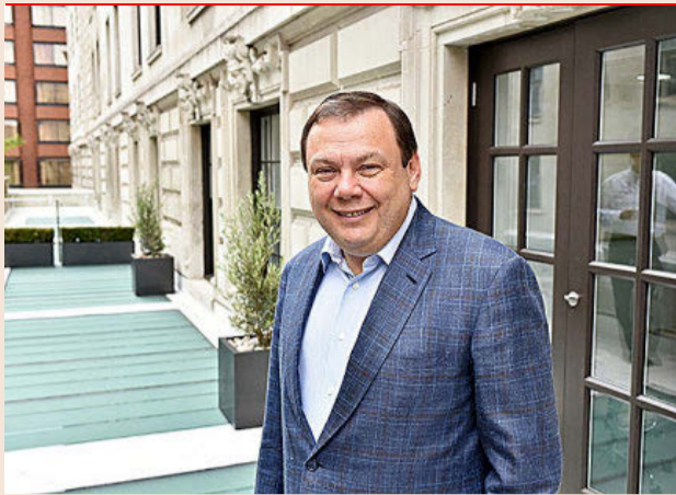
Mikhail Fridman, máximo accionista de Dia.